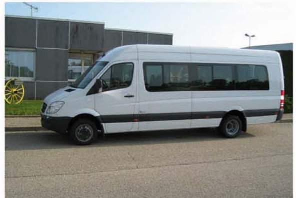
Véhicules présentés avec options.

Vehixel se réserve le droit de modifier ces caractéristiques sans préavis. Document non contractuel.